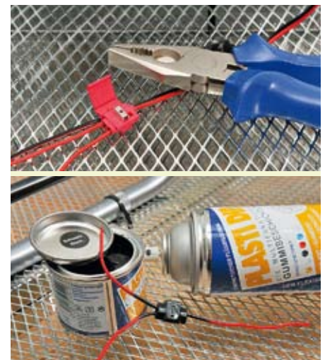
Saubere Arbeit: Kabelverbinder sorgen für stabile Kontakte, „Liquid Tape“ (unten) für deren perfekte Isolierung.

Stabiles Klebeband ist die Mindestanforderung an eine vernünftige Isolierung freiliegender Kontakte oder Leitungsadern. Deutlich fugendichter, haltbarer, einfacher und auch optisch ansprechender isoliert flüssiges Isolierband („Liquid Tape“ ab € 14,00 / 100 ml), das es im Kfz-Zubehör zu kaufen gibt. Einfach mit dem Pinsel dick aufgetragen, härtet das Flüssiggummi innerhalb von