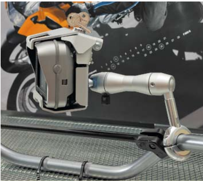
Massive Abschreckung: Wunderlich abschließbare Halterungen (links) sichern u. a. TomToms Rider-Versionen.