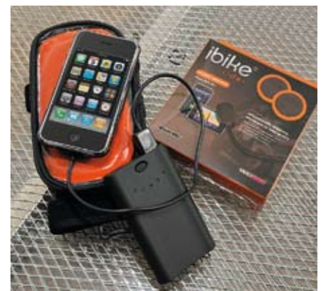
Bringt das iPhone an den Lenker: Das „Moto Kit iPhone“ mit 15h-Zusatzakku, Helmlautsprechern und Lenkertasche.

Bereits in unserer viel beachteten Folge „GPS für Mac und iPhone“ hatte das legendäre Handy in Kombination mit spezieller Navigations-Software – den sogenannten „Apps“ – gezeigt, was es kann. Vor allem das auch in heller Umgebung gut ablesbare Display des iPhone sowie der integrierte, ordentlich schnelle GPS-Empfänger ermöglichen eine nahezu tadellose Navigation. Zumindest, bis der Handy-Akku die weiße Fahne hisst und das Gerät abschaltet. Gerade für stromfressende, weil lang laufende Anwendungen empfehlen sich leistungsfähige Zusatzakkus entweder direkt aus dem – oftmals teuren – Zubehörsortiment des Handyherstellers, oder aber die Ideen findiger Drittanbieter. Wie zum