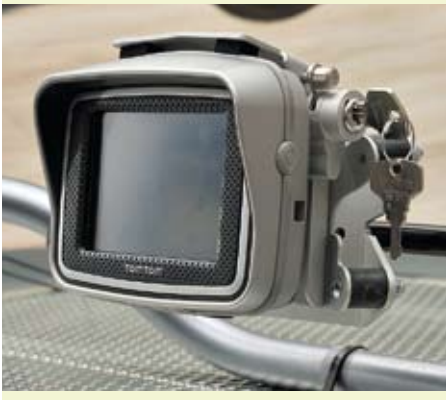
Touratechs abschließbare Lösungen (unten) gibt es u. a. für TomTom, Garmin, Magellan und Becker.